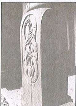
TRADISJON: Treskjæring er med på å prege den spesielle hytta som flere lokale firma samarbeider om.

leverer billigere produkt fra utlandet. Derfor vil ei slik kvalitetshytte hvor folk får se hva de får bety mye i markedsføringen.