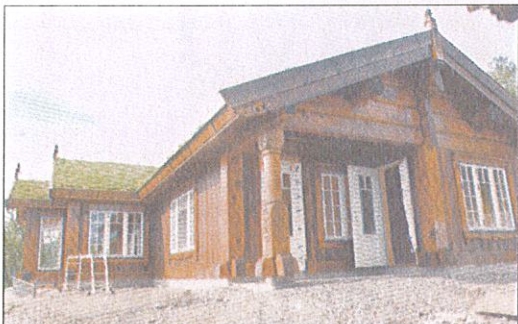
VISNINGSHYTTE: Denne hytta er et samarbeidsprosjekt med mange firma i Oppdal, og har spesielle kvaliteter både inne og ute.

«Konkurransen på hyttemarkedet er stor, og det kommer stadig flere leverandører som leverer billigere produkt fra utlandet. Derfor vil ei slik kvalitetshytte hvor folk får se hva de får bety mye i markedsføringen»