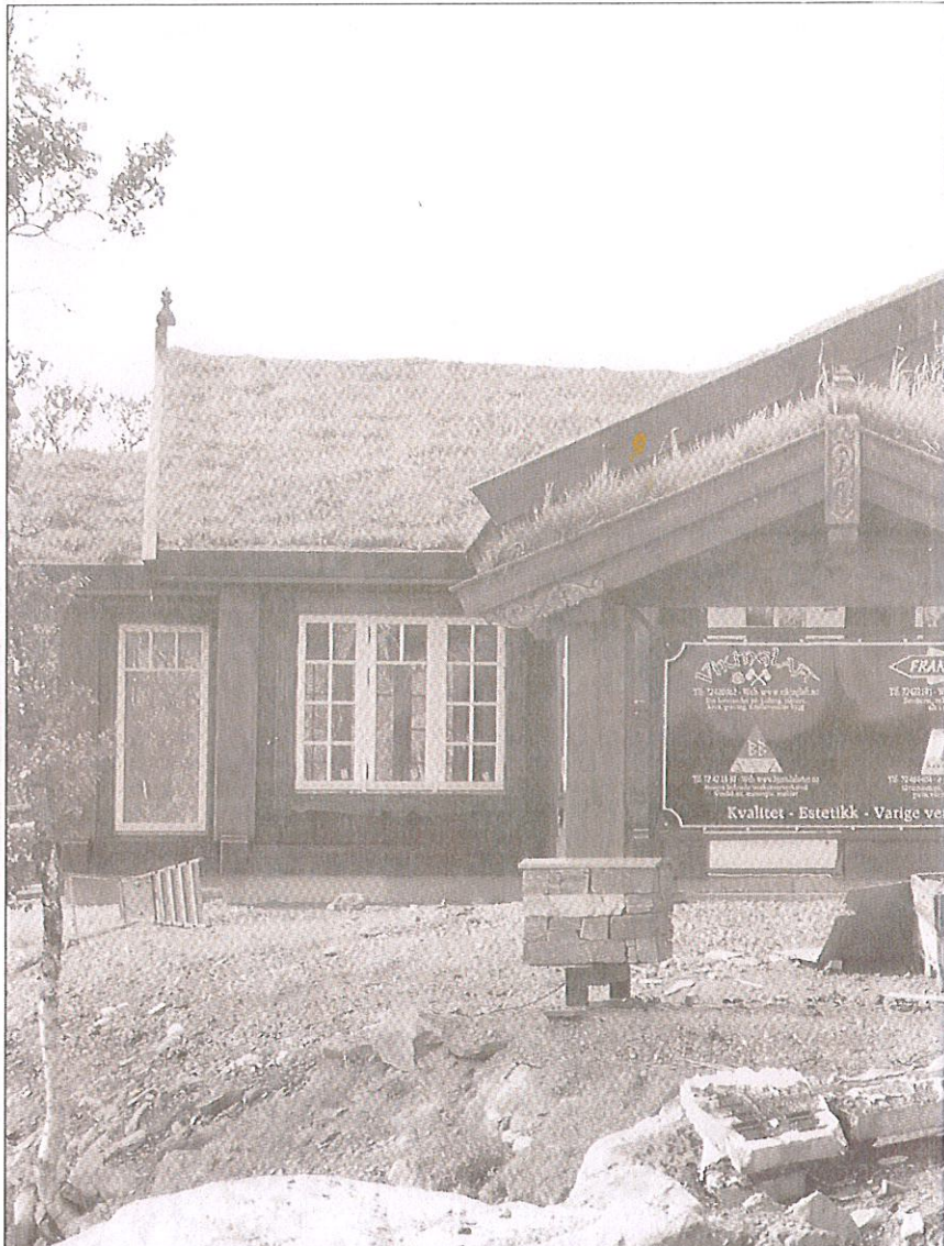
SAMARBEID: På et skilt foran hytta står det hvilke firma som er med og bygger i et nært samarbeid.

«Konkurransen på hyttemarkedet er stor, og det kommer stadig flere leverandører som leverer billigere produkt fra utlandet. Derfor vil ei slik kvalitetshytte hvor folk får se hva de får bety mye i markedsføringen»