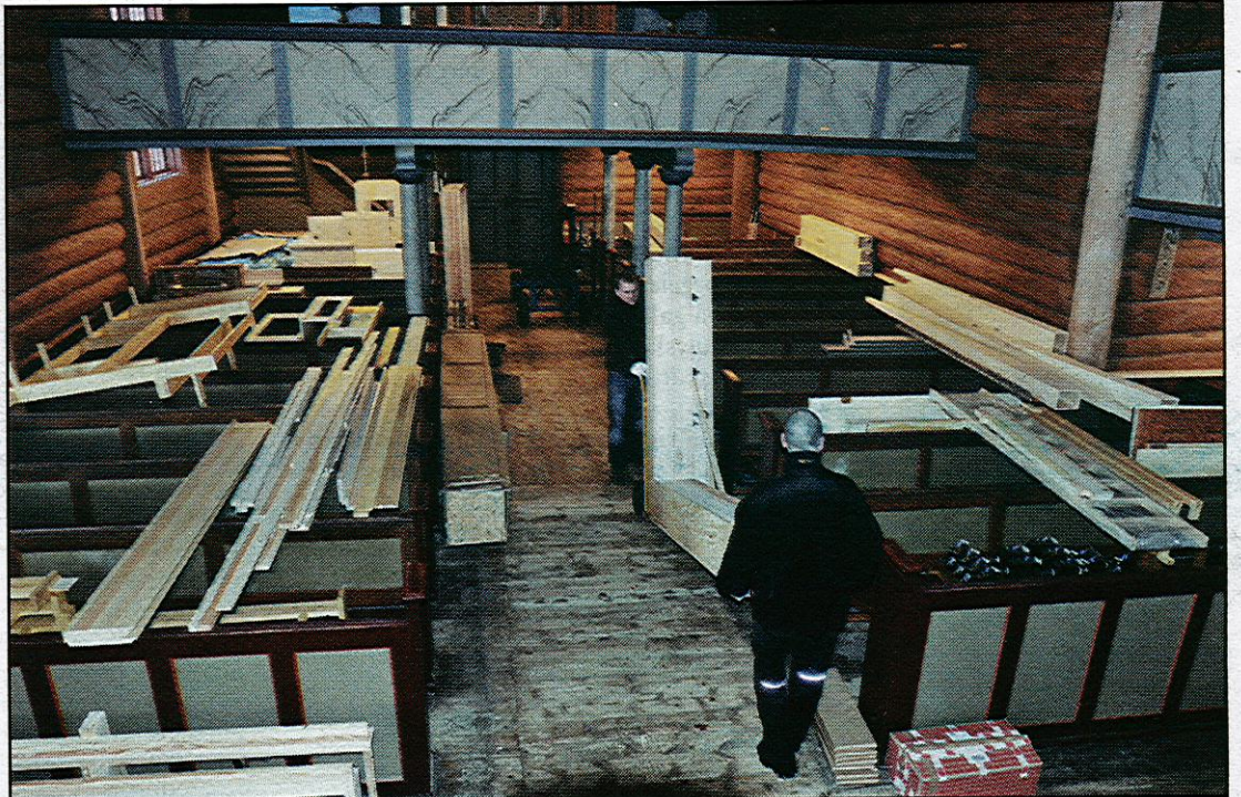
Delene til ny-orgelet er spredd utover kirkerommet.

Forøvrig benyttes en rekke treslag i orgelet. Det viser delene i både nordisk furu, oregon-pine (amerikansk furu), eik og mahogni som ligger spredt rundt om i ben-